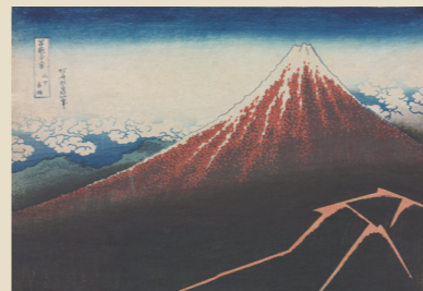
葛飾北斎「富嶽三十六景 山下白雨」 江戸時代 天保2~4年(1831~33) 【展示期間:10/11~12/10】

風景画ブームはここから始まった。 70歳を過ぎて生み出された衝撃の版画シリーズ。