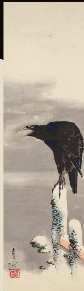
葛飾北斎「雪中鴉図」 江戸時代 弘化4年(1847) ひとり鳴く鴉は自画像か。 数え年88歳の力作。