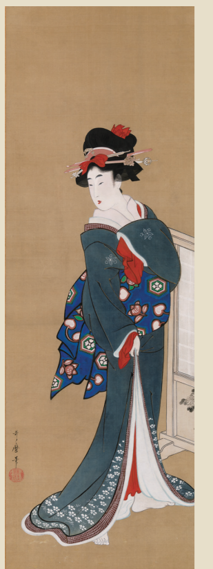
喜多川歌麿「芸妓図」 江戸時代中期 これぞ粋! きりっと決めた芸者の立ち姿。