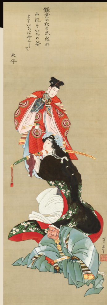
葛飾北斎「堀河夜討図」 江戸時代後期 北斎得意のかっこいいヒーロー像。

風景画ブームはここから始まった。 70歳を過ぎて生み出された衝撃の版画シリーズ。