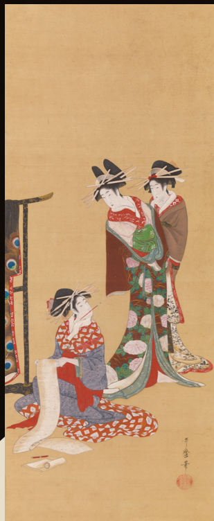
喜多川歌麿「三美人図」 江戸時代中期 歌麿だから描けた、遊女たちの素の時間。

江戸本所(現在の墨田区)に生まれる。数え年19歳の時、人気浮世絵師の勝川春章に入門して絵を学ぶ。版画、版本、肉筆画制作のすべてに情熱を注いで森羅万象を描き、90歳の長寿を全うした。北斎のほか戴斗、画狂人、卍など度重なる改名、生涯に93回という転居癖をはじめ奇行も多い。