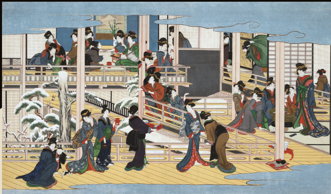
喜多川歌麿「深川の雪」 江戸時代 享和2~文化3年(1802~06)頃 【展示期間:9/8~12/10】※左記以外は高精細の複製画を展示 歌麿最晩年の傑作は、縦2m、横3.5mの大迫力。

岡田美術館は、本年10月に開館10周年を迎えます。記念展第2部に登場するのは、浮世絵師の喜多川歌麿と葛飾北斎。次々と新しいスタイルの作品を生み出し、大衆の心をつかんだ浮世絵界のスターです。2人はほぼ同時期に画壇にデビューしましたが、先に歌麿が美人画で一躍人気を集め、一方の北斎は美人画にとどまらず、風俗画、風景画、花鳥画、武者絵など多彩な分野に挑戦し、90年の長い生涯に数えきれないほどの作品をのこしました。