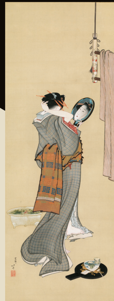
葛飾北斎「夏の朝」 江戸時代後期 北斎50歳前後、美人画の頂点を示す名品。