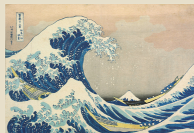
葛飾北斎「富嶽三十六景 神奈川沖浪裏」 江戸時代 天保2~4年(1831~33) 【展示期間:8/8~10/10】