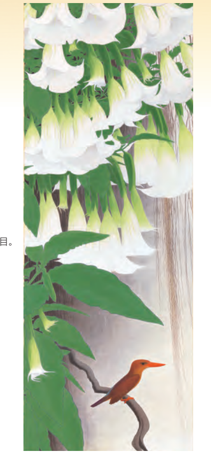
田中一村「白花と赤翡翠」 昭和42年(1967) 奄美大島で絵に専念した幸福な3年間の最初の頃の作品。

2023年秋に開館10周年を迎える岡田美術館では、これまでの展覧会においてとりわけ人気の高かった画家4人を選び、2人ずつ2部に分けて展覧会を開催します。 第1部では、江戸時代の伊藤若冲と昭和時代の田中一村。いずれも、近年、人気が急上昇した画家です。生涯独身を通し、描くことだけを生き甲斐として制作した2人は、写生を徹底したことや、あでやかな彩色、画面に行き渡る緊張感など、作風においても似通う点が認められます。このような生き方・作品の全体を通