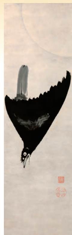
伊藤若冲「月に呱呱鳥図」 江戸時代中期 吉祥の鳥ハハチョウが鳴きながら急降下。