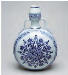
「青花アラベスク文双耳扁壺」 景德鎮窯 中国・明代 永楽年間(1403～24)

■1階展示室 中国の陶磁器と玉器(一部に韓国・日本の陶磁器)を展示。とりわけ中国歴代の陶磁器が質・量ともに充実しています。