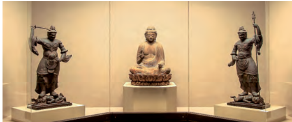
中央「木造薬師如来坐像」平安時代 11世紀 重要文化財 左右「木造二天王立像」平安時代 10～11世紀

■5階展示室 重要文化財「木造薬師如来坐像」をはじめ、仏像や仏画、密教法具など祈りの世界をご覧ください。