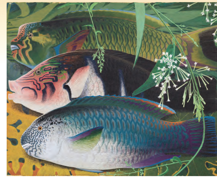
田中一村「熱帯魚三種」 昭和48年(1973) ©2022 Hiroshi Niiyama 亡くなる4年前、65歳の一村が示した新境地。

10周年の感謝をこめて お誕生日 ペア特別ご招待! 誕生日当日のご本人様と同伴者1名様まで無料 ※10周年展第1部・2部会期中のみの実施となります。 ※受付にて身分証明書をご提示ください。