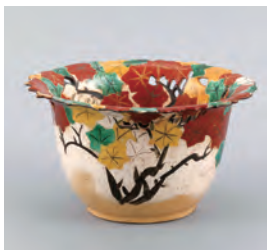
尾形乾山「色絵竜田川文透彫反鉢」 江戸時代中期 18世紀 重要文化財

■1階展示室 中国の陶磁器と玉器(一部に韓国・日本の陶磁器)を展示。とりわけ中国歴代の陶磁器が質・量ともに充実しています。