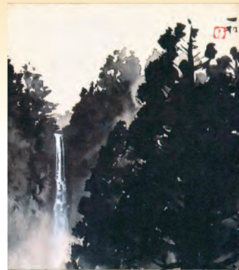
田中一村「瀑布」 昭和30年(1955)頃 「墨画の近代化」を目指した一村の墨絵に注目。

10周年の感謝をこめて お誕生日 ペア特別ご招待! 誕生日当日のご本人様と同伴者1名様まで無料 ※10周年展第1部・2部会期中のみの実施となります。 ※受付にて身分証明書をご提示ください。