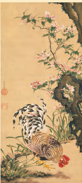
伊藤若冲「花卉雄鶏図」 江戸時代中期 青物問屋の主人を務めた時期の初期作。

たなか いっそん 田中一村 (1908~77) 現在の栃木市に彫刻師の長男として生まれ、5歳のとき東京に移る。17歳で東京美術学校(現東京藝術大学)に現役合格するものの2か月余りで退学し、独学で制作を続ける。29歳から千葉で暮らしたのち、50歳のとき奄美大島に単身で移住し、亜熱帯の生き物を題材に描いた。画壇から離れ「私の良心を納得させる為に」描いた絵が、多くの人々に感動を呼び起こしている。