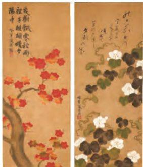
尾形乾山「夕顔・楓図」 江戸時代 元文5年(1740)頃

■4階展示室 2023年に生誕360年を迎える尾形乾山のやきもの19件と絵画2件を一室に集め、京焼を大きく発展させた乾山焼と、晩年に描いた絵画の魅力を紹介いたします(第1・2室)。そのほか土偶・埴輪・青銅器など古代の工芸、韓国陶磁、日本絵画の名品などを展示。