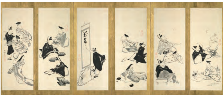
伊藤若冲「三十六歌仙図屏風」 江戸時代 寛政8年(1796) 尊い歌人たちが遊んだり料理をしたり。若冲81歳、最晩年の傑作。

じ、当館館長・小林忠は、一村を「昭和の若冲」と称しています。 本展では、若冲が精力的に描いた30代末頃~40代の着色画と、一村の奄美大島在住時代の代表作、それぞれの墨絵、同じ種類の鳥を描いた絵など、2人の絵をさまざまに組み合わせ展示します。若冲7件・一村7件の作品を中心に、関連画家の作品、伝統的な花鳥画の屏風絵などを併せた約40件の多彩な展示をお楽しみください。 ※若冲の1件「雪中雄鶏図」の展示期間は3/10~6/4。一村の2件は個人蔵、他は当館蔵。