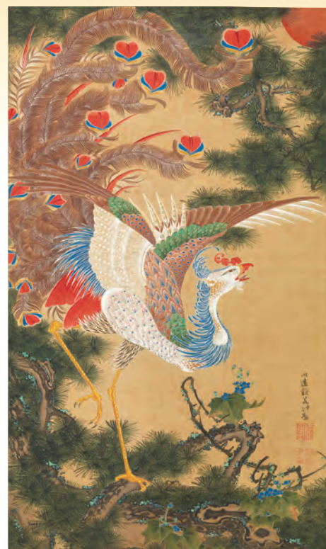
伊藤若冲「孔雀鳳凰図」 江戸時代 宝暦5年(1755)頃 重要美術品 家業を弟に譲り画業に専念した数え年40歳頃の大作。大名家の旧蔵品。