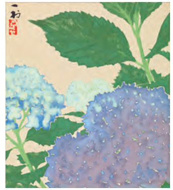
田中一村「あじさい」 昭和30年(1955)頃 一村が好んだ「荒ッポイ表現法」のアジサイ図。