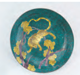
「色絵竹虎文大皿」 有田・古九谷様式 江戸時代前期 17世紀中頃

■2階展示室 古九谷、鍋島、柿右衛門といった肥前磁器や野々村仁清の京焼など日本のやきものと、カラフルな和ガラスをご紹介します。