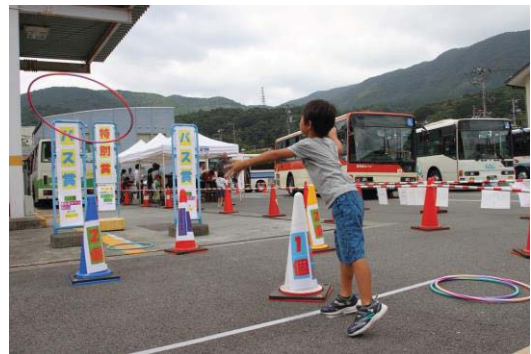
とてもビックな輪投げ