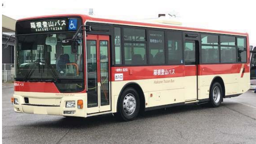
白色LED行先表示器搭載車両