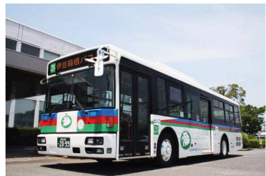
伊豆箱根バス車両