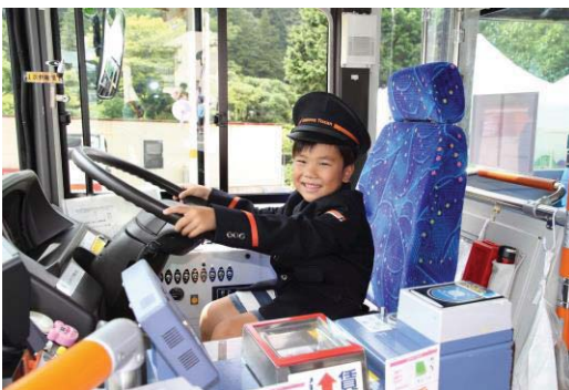
なりきり運転士体験