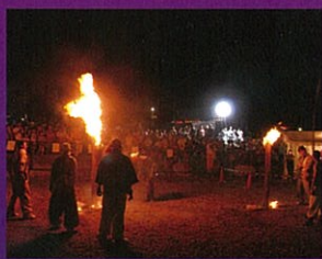
大文字たいまつ焼実演