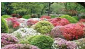
歴史あるつつじの名所「蓬莱園」徒歩2分