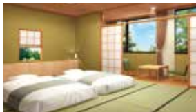
和の空間を基調としたすっきりとしたデザイン ～和室イメージ～