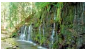
ひっそりと佇む「千条の滝」徒歩15分