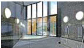
泉質豊かな箱根十七湯のひとつ「小涌谷温泉」 大浴場はかけ流し温泉露天風呂