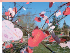
愛の木に結ばれたハートのカード