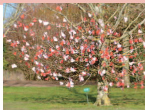
村の庭園にある「メリー愛の木」