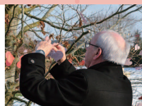
愛の木にカードを結ぶ セント・ヴァレンティン村の村長