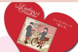
「メリー愛の木メッセージキャンペーン2015」 メッセージ用紙

ハート型の専用メッセージカードに恋の願いを書いて記に飾ると、後日セント・ヴァレンティン村の「愛の木」に掲げ あなたの願いを聖地に届けます。